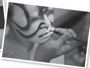
Thực diễn hóa trang