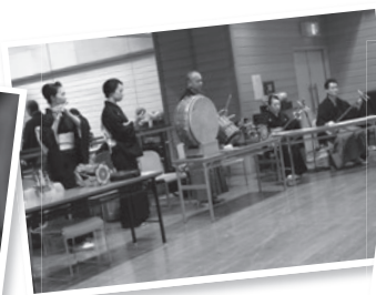
Âm nhạc trong Kabuki