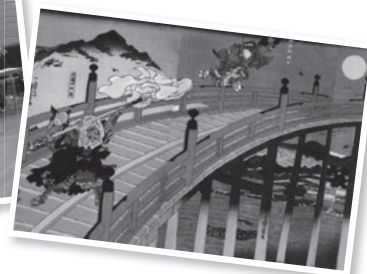
Tranh phù thể Cầu Gojo