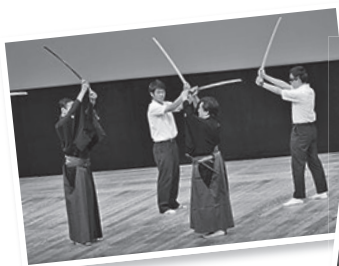
Giao tranh tachimawari

Vui lòng xem trang chủ để biết thêm chi tiết.