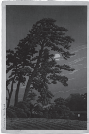
"मोमागेनो चुकी" "टोक्योको बीस दृश्यहरू" 1930 सालमा चित्रित

हासुइ कावासे ओता सहरमा लामो समय बसोबास गरी चित्र कोरेर जीवन बिताएका चित्रकार हुन्। हासुइ कावासेले पूरै जापान हिँडेर हरेक ऋतुमा विभिन्न ठाउँहरूको दृश्यहरूको चित्र कोरे। उनले आफ्नो जीवनकालमा कोरेका चित्रहरू 600 भन्दा धेरै छन् भनेर भनिन्छ। यसपटकको विशेष प्रदर्शनीमा प्रारम्भिककालदेखि बुढेसकालसम्मको चित्रहरूका साथै स्केचबुक, दैनिकी, मन पराएका चीजहरू, फोटो आदि पहिलो र दोस्रो चरणमा विभाजन गरी प्रदर्शन गरिनेछ। पहिलो चरणमा मुख्य रूपमा, विशेष भावना भएको "टोक्यो" को दृश्य जुन हासुइको जन्मस्थल पनि हो र दोस्रो चरणमा यात्रा मन पराएका हासुइ गएका "गन्तव्य" को दृश्यको परिचय गराइनेछ।