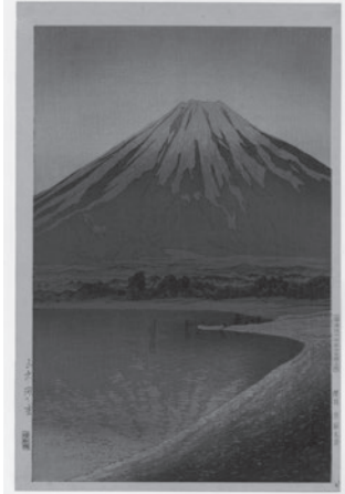
"यामानाकाकोनो आकाचुकी" 1931 साल अगस्टको तस्बिर

हासुइ कावासेले चित्रमा कैद गरेका सुन्दर जापानको दृश्य हेर्न नछुटाउनुहोस्।