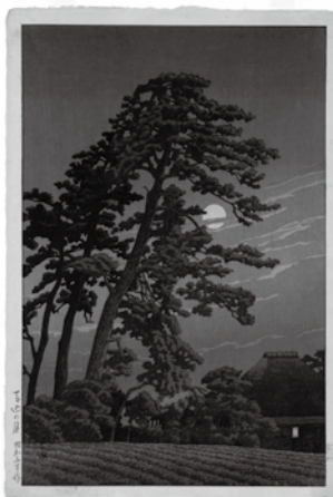
“马込之月”《东京二十景》 1930年作

此次的特别展中展出其早期到晚年作品，同时还将分为前期和后期展出写生贴、日记、常用物品和照片等。在前期中，将主要介绍作为巴水的出生地，即融入感情的“东京”风景，后期将介绍喜爱旅行的巴水到访的“旅行地”风景。