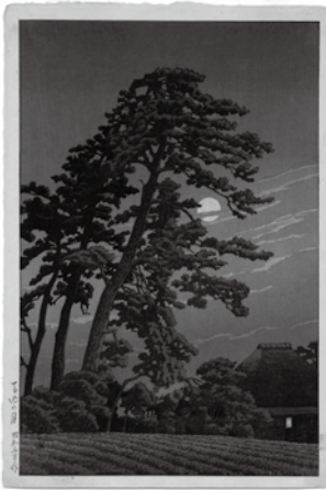
まごめ つき とうきょうにじつげい 『馬込の月』『東京二十景』 ねんさく 1930 年作

絵と 一緒に、写真帖 (絵を 描く ノート)、日記、使っていたもの、写真などを 見ることが できます。前期 (絵を 描いた はじめの 時期) の 絵では、巴水が 生まれた「東京」の 風景を 紹介します。後期 (絵を 描いた おわりの 時期) の 絵では、「旅先」(旅行した ところ)の 風景を 紹介します。