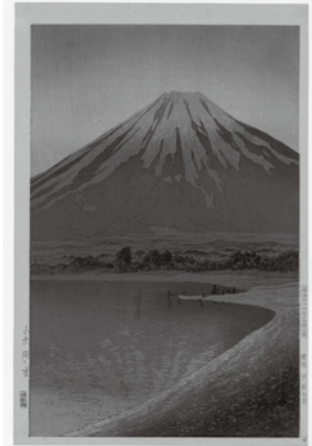
やまなかこ あかつき 『山中湖の暁』 ねん がつ 1931 年 8 月写