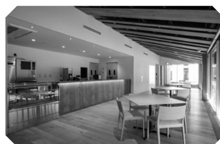
Tiệm cà phê