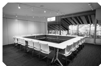
Phòng Tập hợp