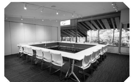
Silid para sa pagpupulong