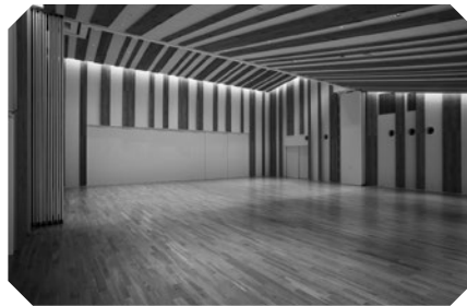
Multipurpose room 1

Maaaring bumili ng tinapay at kape rito, at maaaring kumain rito.