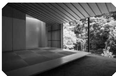
和室 (たたみの 部屋)